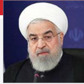
یکصد و هفتاد و ششمین جلسه ستاد هماهنگی اقتصادی دولت به ریاست

کریبی قنوسی، نماینده مشهد اظهار کرد: ما آنچه را که توانستیم در یمن انجام دادیم و بیشتر هم می توانستیم اما در گذشته غفلت شد از جمله حرکت چند کشتی برای ارسال کمک های مردمی به یمن که با تماس جان کری این کشتی ها متوقف شد. در مجلس نهم نمایندگان از مجلس انتخاب شدند و همراه کشتی حرکت کردند اما به باب المنند که رسیدند از طرف دولت ایران به آنها دستور بازگشت داده شد.